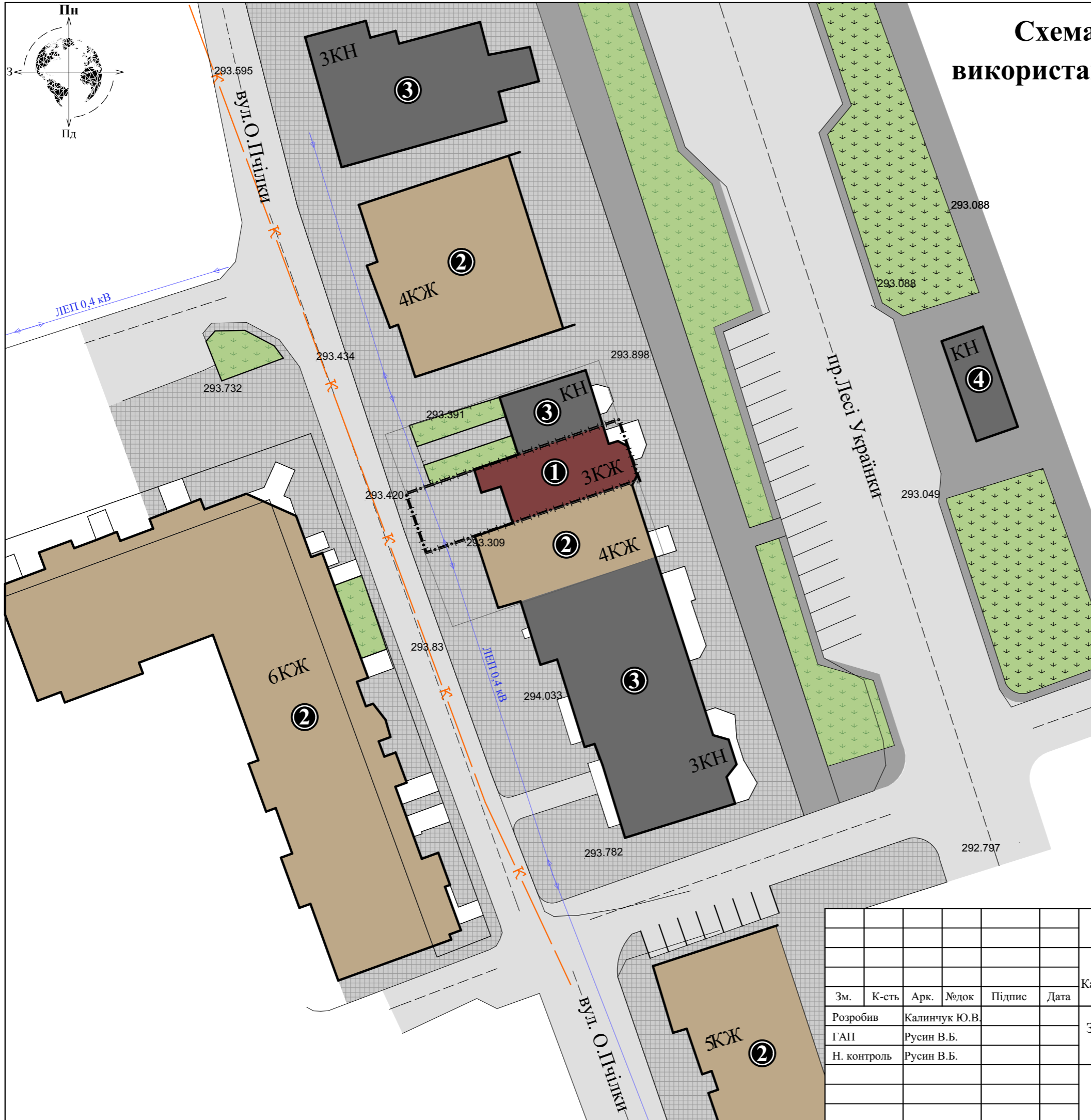
Схема інженерних мереж, споруд і використання підземного простору М 1:500